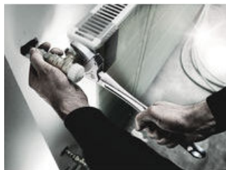
Joker 6004: Automatické a plynule samonastavitelný