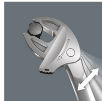
Joker 6004: Ráčnová mechanika pro rychlé "šroubování" nebo "utahování"

Funkce ráčny zajišťuje rychlé a plynulé utahování bez sejmutí klíče.