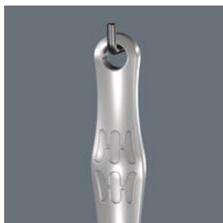
Joker 6004: Praktická závěsné očko

Díky závěsnému očku lze klíč Joker řádně uložit na stěnu v dílně.