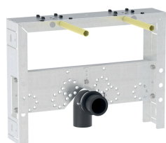
Obrázek s příkladem