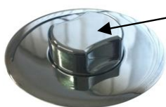
ilustrační obrázek ovládání