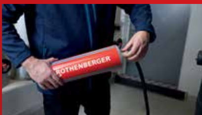
Rychlá a snadná instalace pomocí "Plug and Play"-System