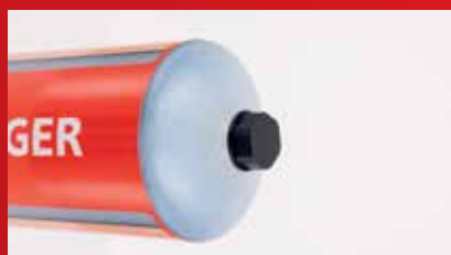
Šroubovací víčko pro snadné otevření a instalaci