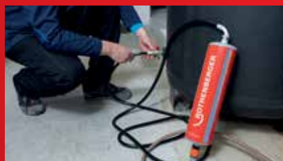
Normované plnění topných zařízení