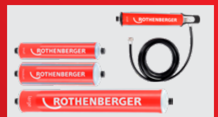
Dostupné ve velikostech S/M/L a jako set ve vel. S včetně uchycení ke zdi a plnicí hadice