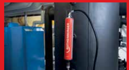
Sada ve velikosti S s upnutím na zeď a plnicí hadicí pro správnou demineralizaci vody