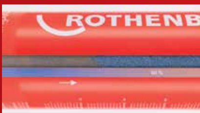
Jednoduchý přehled o procesu bez dalších pomůcek či náradí