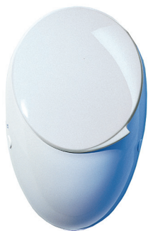
SLP 14 - JOLY S POKLOPEM