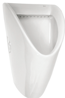
SLP 27 - CHIC