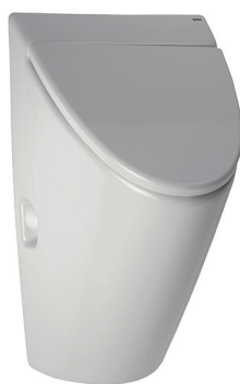
SLP 32 - ARQ S POKLOPEM