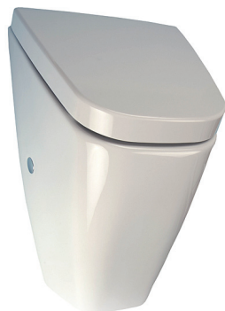
SLP 37 - VILA S POKLOPEM SOFT - CLOSE