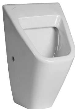
SLP 12 - VILA