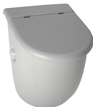
SLP 33 - CASA S POKLOPEM