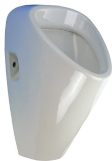
SLP 19 - GOLEM