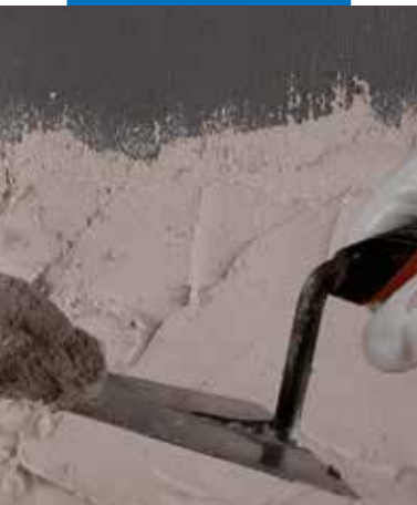
Aplikace omítky na Eco Prim Grip Plus