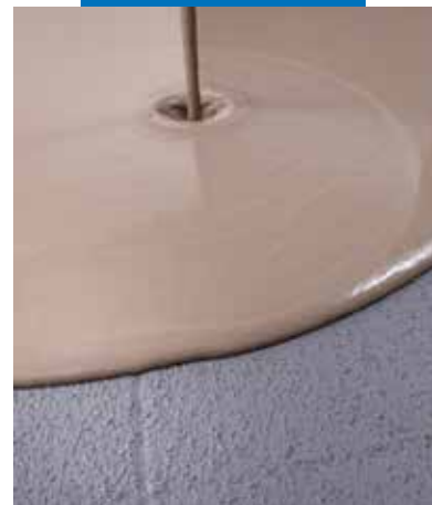
Aplikace samonivelační stěrky na vyschlý Eco Prim Grip Plus aplikovaný na staré podlaze