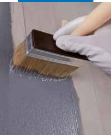
Aplikace Eco Primu Grip Plus štětkou na betonový podklad