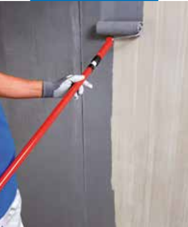
Aplikace Eco Primu Grip Plus válečkem na betonový podklad