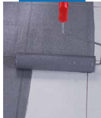
Aplikace Eco Primu Grip válečkem na stávající keramickou dlažbu typu gres

Informace o tomto výrobku jsou k dispozici na požádání a na stránkách firmy MAPEI www.mapei.cz a www.mapei.com