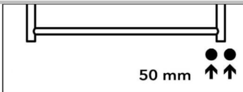
na jednu stranu

INTERRC + M15B4002 + PMH-ET2-C-XXXW* INTERRC + M16B2002 + PMH-ET2-C-XXXW*