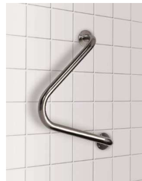
Nástěnné úhlové držadlo