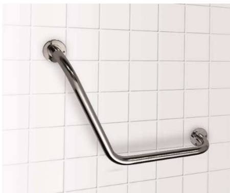
Nástěnné úhlové držadlo 120°