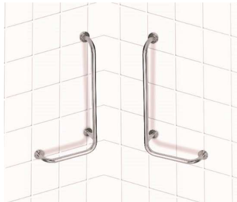
Nástěnné opěrné držadlo