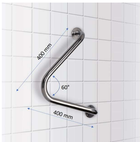
Nástěnné úhlové držadlo 60°