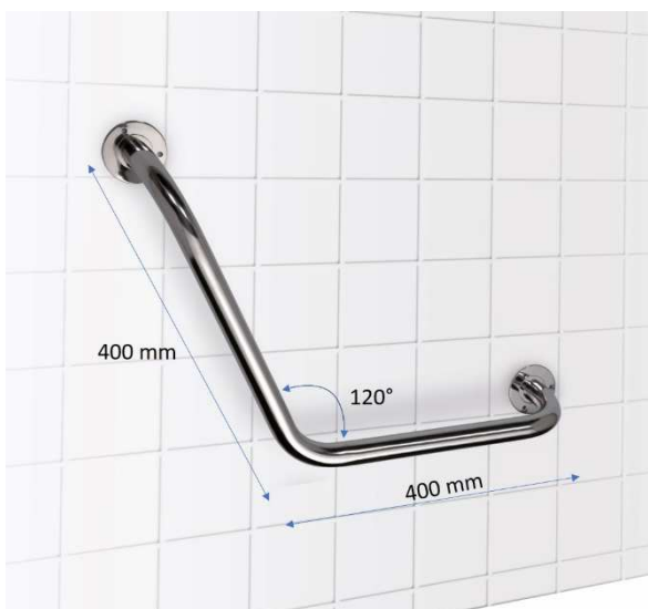
Nástěnné úhlové držadlo 120°