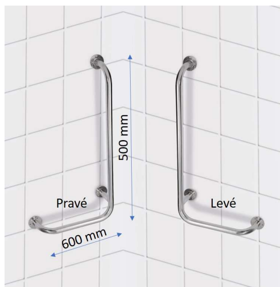
Nástěnné opěrné držadlo 600x500