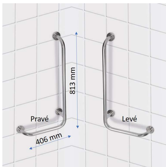
Nástěnné opěrné držadlo 406x813