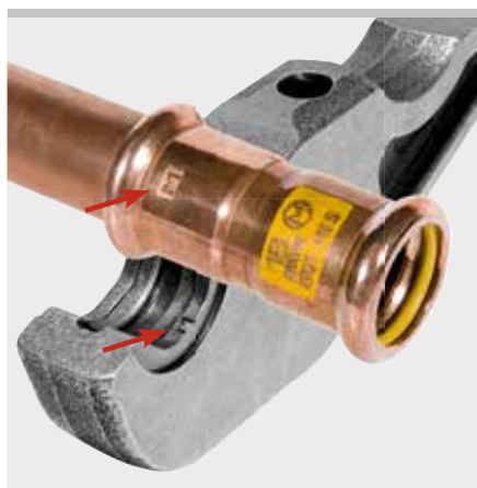
Příklad lisovacích kleští REMS M: Otisk "M" na zalisované tvarovce pro zpětné dosledování dle EN 1775:2007

Tímto zpětným dosledováním splňuje REMS doporučení evropské normy EN 1775:2007 pro instalace lisovaných systémů na plyn.