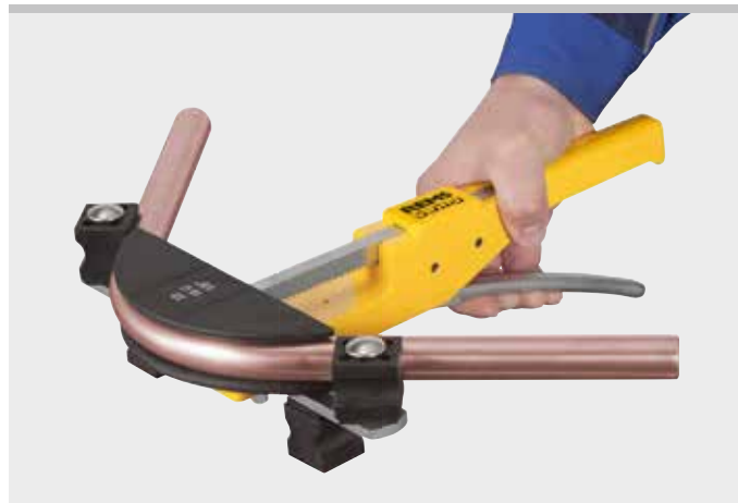
Kvalitní německý výrobek