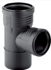
Obrázek s příkladem