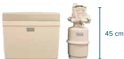
TALENT 100B KAPACITA NÁDRŽE NA SOLNÝ ROZTOK: 25 KG

OBJEM ŽIVICE: 3 LITRE – PRIETOK: 1 500 LITROV ZA HODINU