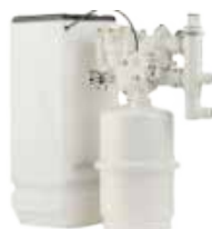
TALENT 100BS KAPACITA NÁDRŽE NA SOLNÝ ROZTOK: 10 KG