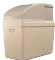
TALENT 100M KAPACITA NÁDRŽE NA SOLNÝ ROZTOK: 15 KG

Veľmi kompaktný zmäkčovač vody typu všetko v jednom Dá sa pripojiť zozadu alebo z oboch strán.