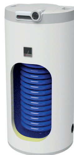
OKC 160 NTR/HV