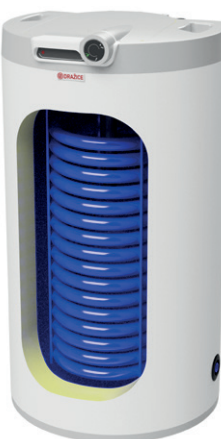
OKC 100.1, 125.1 NTR/HV