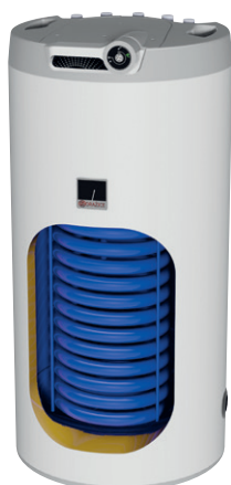
OKC 100, 125 NTR/HV