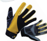
Pracovní ochranné pomůcky