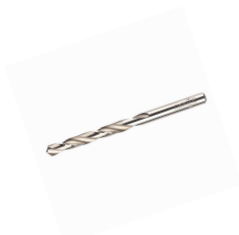
Vrták průměr 10 mm