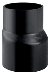
Obrázek s příkladem