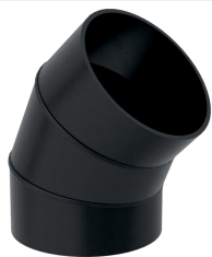
Obrázek s příkladem