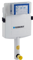
Obrázek s příkladem