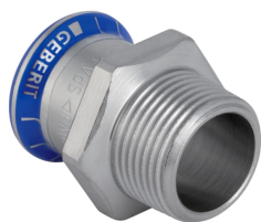
Obrázek s příkladem