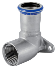
Obrázek s příkladem