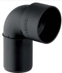
Obrázek s příkladem