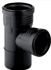
Obrázek s příkladem