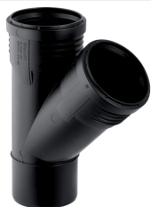
Obrázek s příkladem