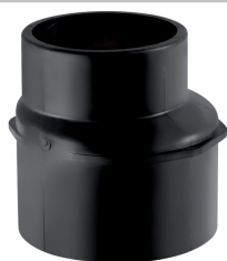
Obrázek s příkladem