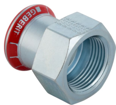
Obrázek s příkladem