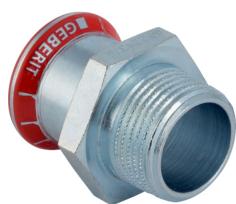
Obrázek s příkladem