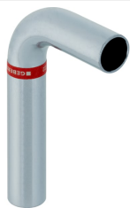
Obrázek s příkladem