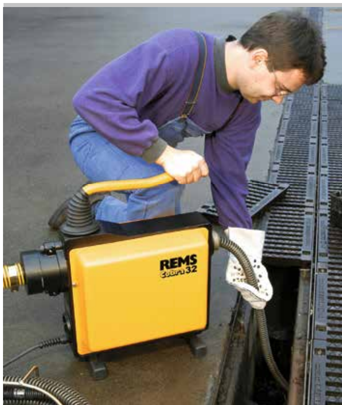
Kvalitní německý výrobek