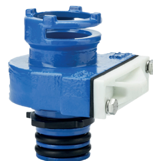
Planžetový adaptér 8.4.7