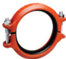
2 – 12"/50 – 300 mm