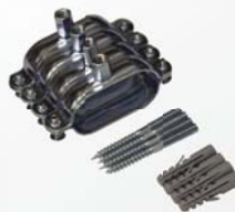
12 934 (DN 12), 9 641 (DN 16) a 9 646 (DN 20)