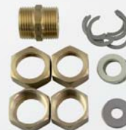
14 841 (DN 12), 9 644 (DN 16) a 9 645 (DN 20)