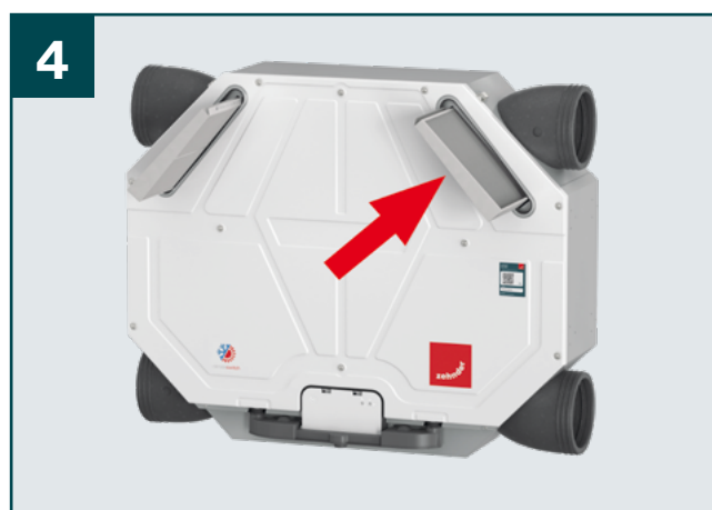
4 Zasuňte nové filtry