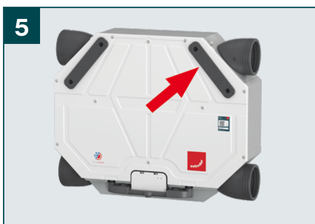
5 Vraťte krytky filtrů