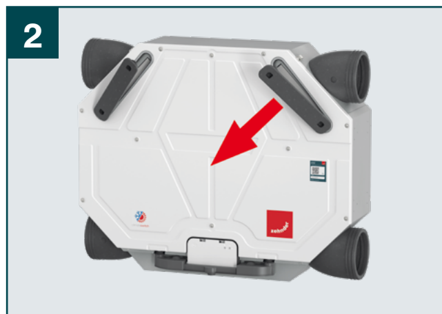
2 Sundejte krytky filtrů