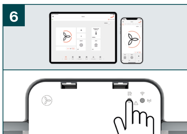
6 Stiskněte tlačítko pro obnovení funkce větrání