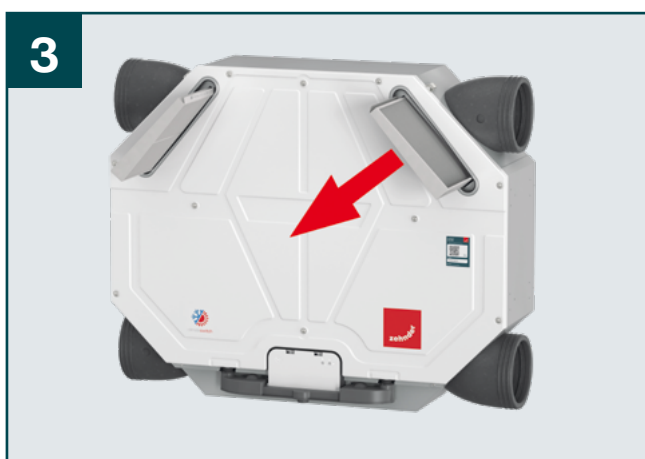
3 Vyndejte staré filtry