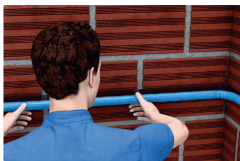
Předizolovaná Uponor Uni Pipe PLUS