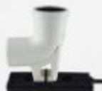
Obj. kód: 11954

Do systému je možné přidat např. vsuvku s revizním otvorem (6), případně další díly běžné pro jednoduchý systém o průměru 80 mm. Pro vložení dalších dílů do flexibilní trubky je nutné doobjednat další sadu zakončení (1x hrdlo, 1x trubka). Samostatně objednat lze i jednotlivé prvky komínové sady.