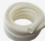
Balení 20 m: Obj. kód: 16115

Komínová sada – obsahuje komínovou hlavici (5), patní koleno (2) a 5 vystředovacích dílů (3). Součástí je sada zakončení (4a, 4b) flexibilní trubky, která umožňuje napojení flexibilní trubky na ostatní prvky systému.