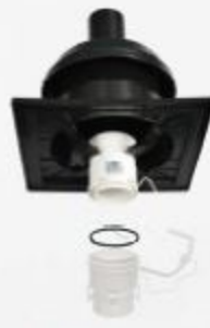
Obj. kód: 15836